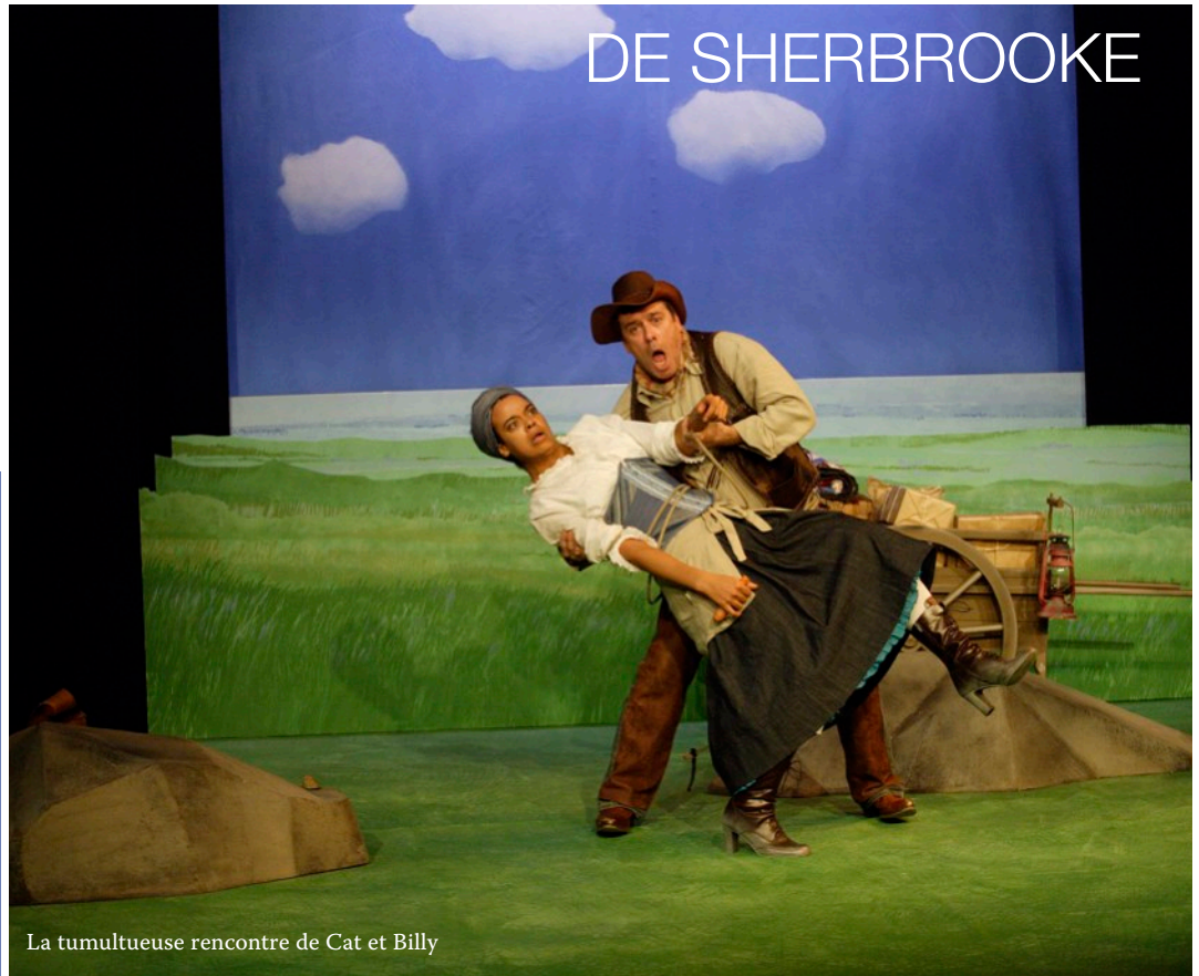
La tumultueuse rencontre de Cat et Billy

Cat et Billy. Et Bidou ! est en nomination à la soirée des Masques pour le prix des Enfants terribles, un Masque confié à l'appréciation du jeune public. Le gagnant sera connu lors du gala qui se tiendra le 17 décembre 2006.