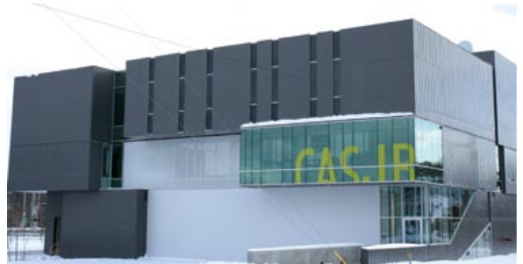
(Photo prise le 6 décembre 2007) Le Centre des arts de la scène Jean-Besré